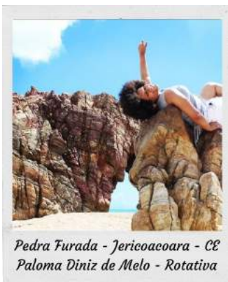
Pedra Furada - Jericoacoara - CE Paloma Diniz de Melo - Rotativa