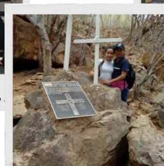
Grotta de Angicos - Poço Redondo - SE Mateus Maciel - Tubos II